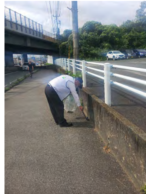
営業所前国道の歩道