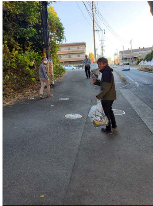
営業所前国道の歩道