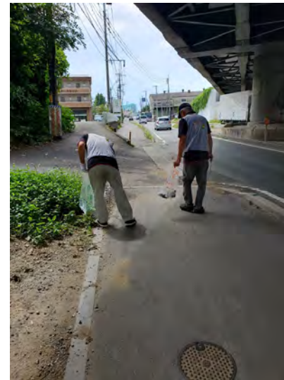
営業所前国道の歩道