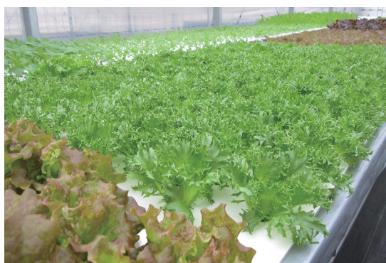
定番の畑やプランターで…