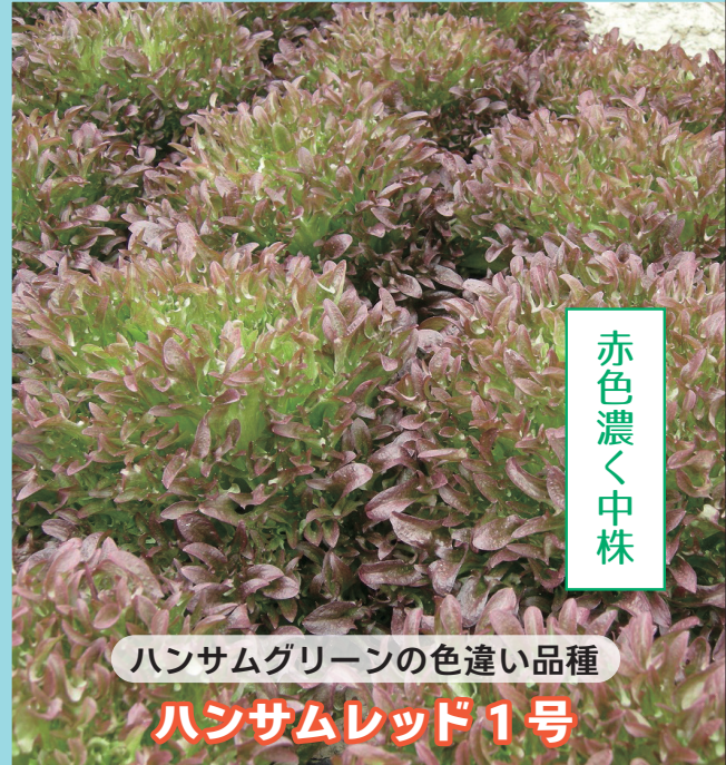
ハンサムグリーン