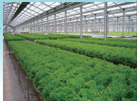
水耕栽培でも人気上昇中